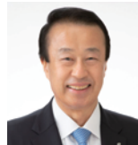
加賀市長 宮元 陸(石川県加賀市)

女性や若い世代の議員を増やしていこうという議論がある一方で、そのための環境は十分ではありません。この度の受賞を機に広く興味・関心を向けていただける効果は大さきと感じています。