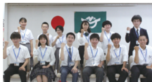
遊佐町少年町長・少年議員 公選事業(山形県遊佐町)

受賞後、地域の方々やメディア、全国自治体議員の皆さんから注目いただき、問い合わせ頂いています。今後も現場の声を可視化して改善に努めてまいります。