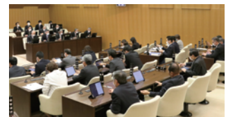
西条市議会(愛媛県西条市)

社会が複雑化する中で、子どもや外国人などを含めた多様な市民が、社会に参画していく、そんなきっかけづくりにこれからも取り組んでいきたいと思えます。