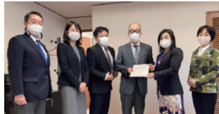
出産議員ネットワーク・子育て議員連盟(東京都豊島区)