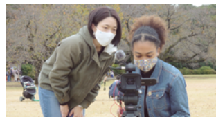
一般社団法人リテラシー・ラボ(東京都世田谷区)

受賞後、お問合せを多数いただきました。多くの方に認知していただけたこと、若者の活動への大きな期待の眼差しを受けていることを励みに、今後も次世代の若者の背中をそっと押していきたいと思えます。