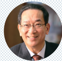
審査委員長 北川正恭

マニフェスト大賞は、地方自治体の議会、首長、市民等による、地域の民主主義向上に資する優れた取り組みを募集し、表彰するものです。これにより、地域で努力を重ねる方々に荣誉を与え、さらなる意欲向上を期するとともに、優れた取り組みが広く知られ互いに競いあうようにまちづくりを進める「善政競争」の輪を拡げることが目的としています。政策本位の政治、生活者起点の政策を推進するために、ご注目頂くとともに、奮ってのご応募をお待ちしています。