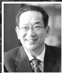
北川正恭 早稲田大学名誉教授